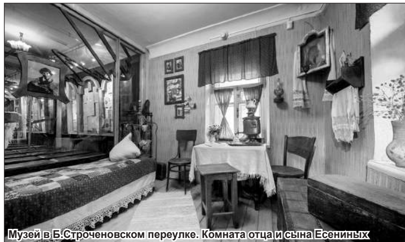
Музей в Б.Строченовском переулке. Комната отца и сына Есениных

И еще один, на этот раз не очень приятный адрес: Большая Полянка, лечебница для нервных больных.