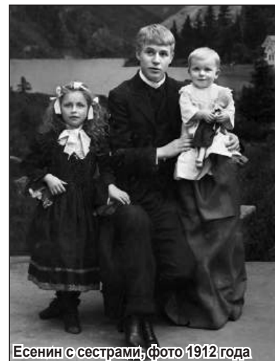
Есенин с сестрами, фото 1912 года

Замоскворечье стало для Есенина не только местом работы, но и источником творческого вдохновения. На Садовнической улице, дом 9, с января 1914 года располагалась редакция ежемесячного журнала «Млечный Путь», который охотно печатал молодых поэтов. Есенин стал постоянным посетителем литературных суббот, проходивших в этом журнале. Именно здесь были опубликованы одни из первых его стихов – «Кручина» и «Выткался на озере алый свет зари». Атмосфера творчества и общения с едино-