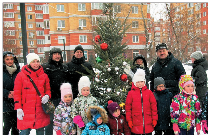
К Новому году в квартале 1296 с участием жителей и муниципальных депутатов была посажена живая ёлка. А дети ее нарядили.