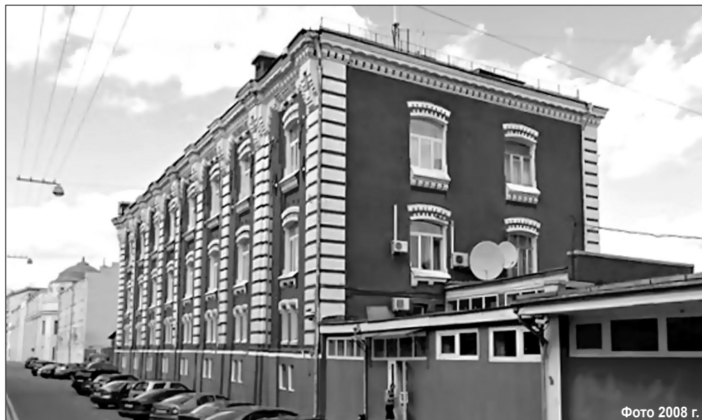
Фото 2008 г.