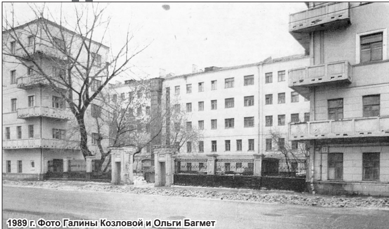
1989 г.