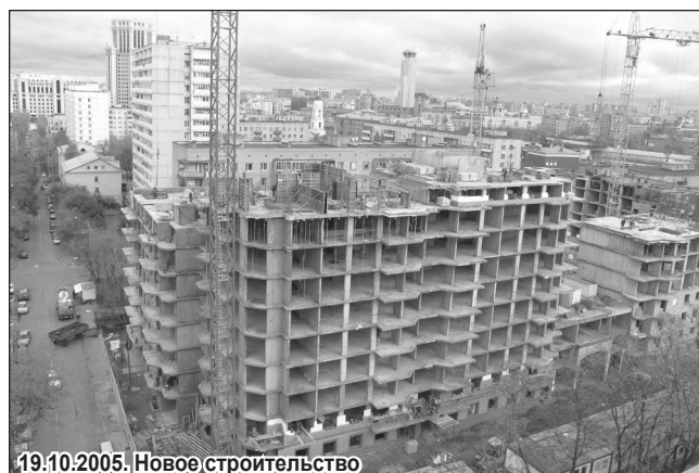
19.10.2005. Новое строительство