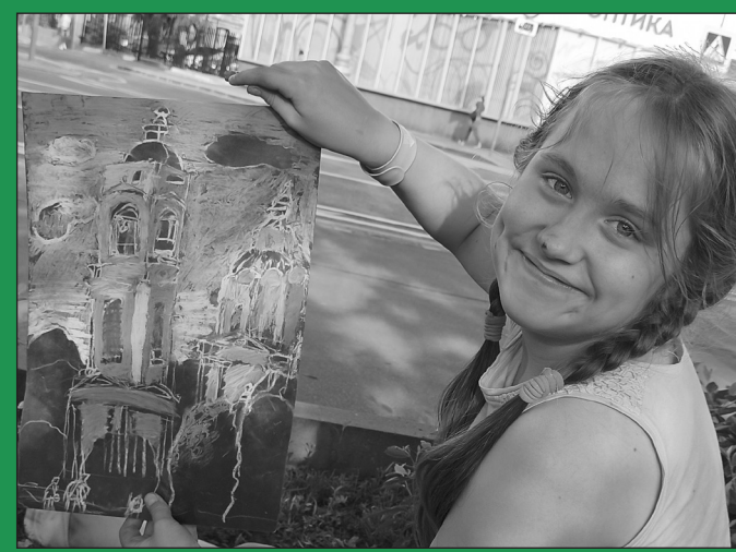
Летние замоскворецкие пленэры художественной студии "Рафаэль"