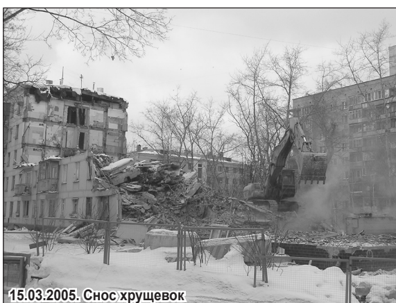
15.03.2005. Снос хрущевки

На месте дома № 40 стояли две хрущевки, расселенные и снесенные в начале 2000-х годов. Жилой дом был построен в 2006 году по индивидуальному проекту. Каркас – монолитный, стены кирпичные. Дом переменной этажности от 6 до 9 этажей. 7 подъездов, 214 квартир. Это второй муниципальный жилой дом района, построенный в постсоветское время (первый – ул. Павла Андреева, 4).