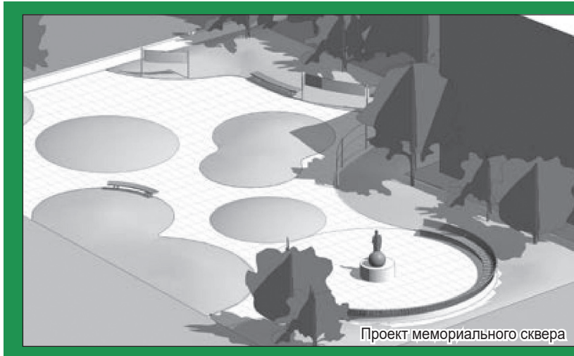
Проект мемориального сквера