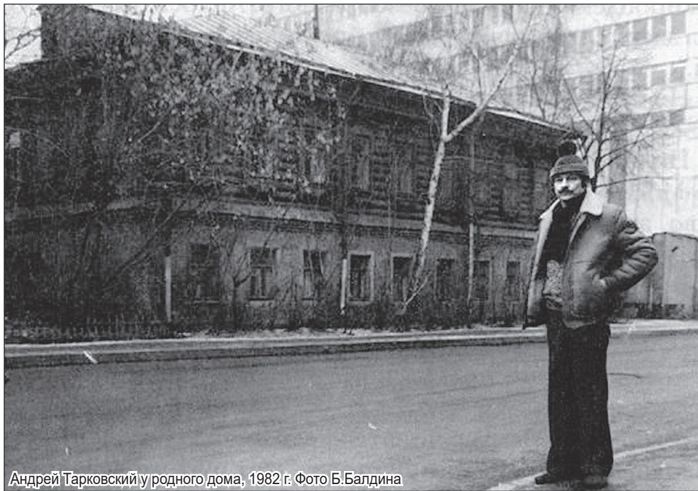
Андрей Тарковский у родного дома, 1982 г.