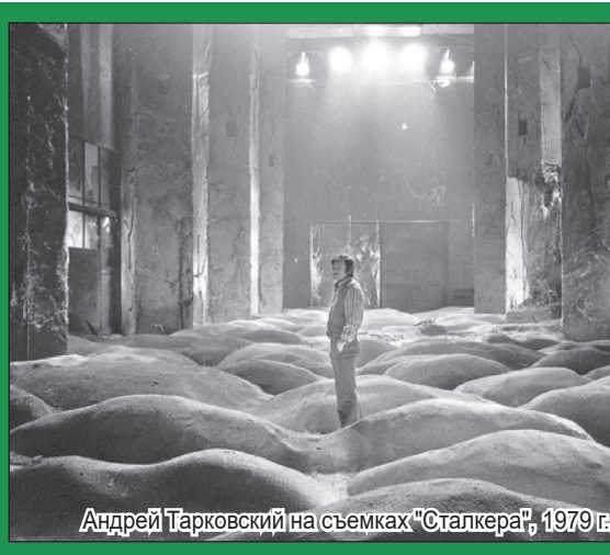
Андрей Тарковский на съемках "Сталкера", 1979 г.