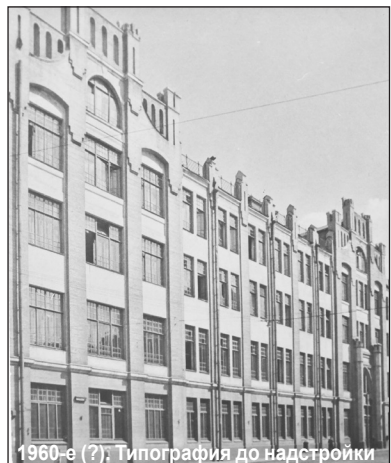
1960-е (?). Типография до надстройки