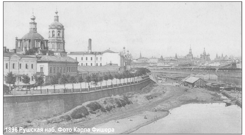
1896 Раушская наб.