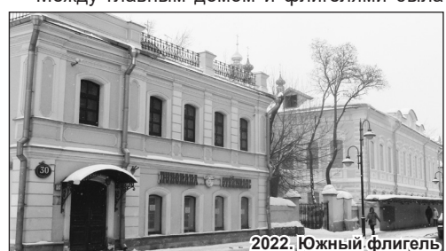
2022. Южный флигель

построена каменная ограда с проездными воротами. Фасад главного здания и фасады флигелей имели идентичное архитектурное оформление: отделку с пластическим декором, свойственным московскому купеческому дому второй половины XIX века. Таким образом, со стороны Пятницкой постройка приобрела законченный вид и воспринималась как единый ансамбль. На первых этажах с улицы были магазины, на втором – квартиры. Таким образом и дошло домовладение до наших дней, и ныне признано объектом культурного наследия.