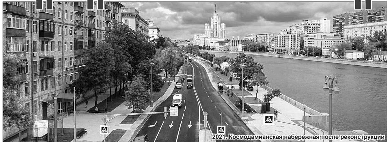
2021. Космодамианская набережная после реконструкции

г. Москвы завершат в весенне-летний период.