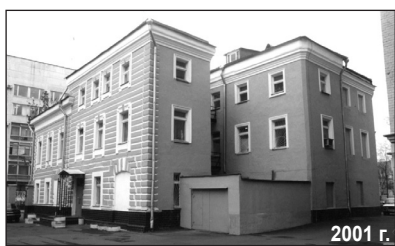
в каменных столбах. Калитка эта частично сохранилась, и мы до сих пор можем видеть часть железной решетки и столб работы архитектора Л. А. Херсонского справа от дома.

Существующий дом построил Ф. М. Мусорин в 1884 году. В марте было подано прошение о разрешении строительства двухэтажного каменного дома с полуподвалом и антресолями, с 7 окнами по фасаду, в левой стороне участка. Уже 2 апреля разрешение на строительство было получено. На месте строившегося дома раньше был сад и беседка, а старый деревянный дом стоял правее. Дом Мусорина сохранился до нашего времени почти без переделок - были только небольшие пристройки: лестницы, тамбуры перед дверями. 9 октября 1901 года было получено разрешение на строительство железных ворот и калитки