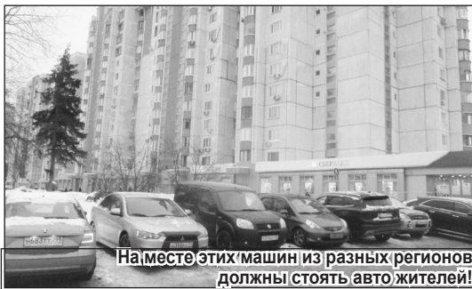
На месте этих машин из разных регионов должны стоять авто жителей!