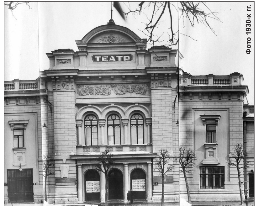
Фото 1930-х гг.