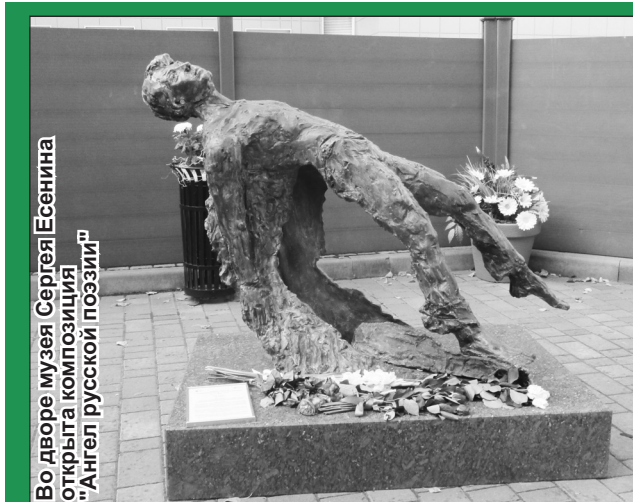
Во дворе музея Сергея Есенина открыта композиция "Ангел русской поэзии"

суббота - 9:00-15:00, воскресенье - выходной.