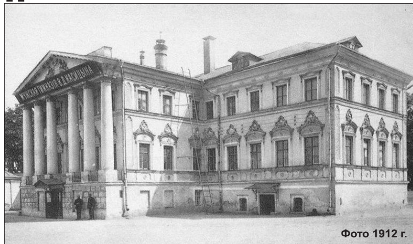
Фото 1912 г.