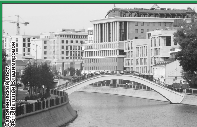
Садовнический мост.