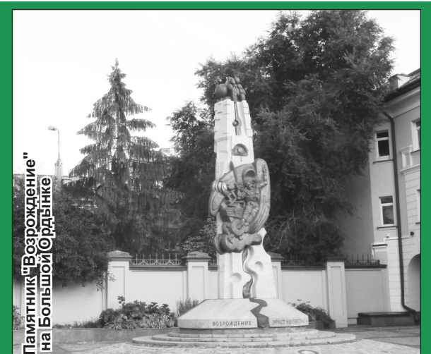
Памятник "Возрождение" на Большой Ордынке