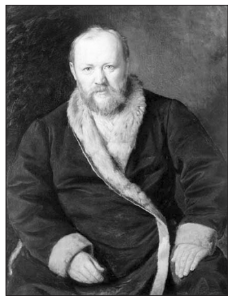
Василий Перов. Портрет драматурга А.Н. Островского