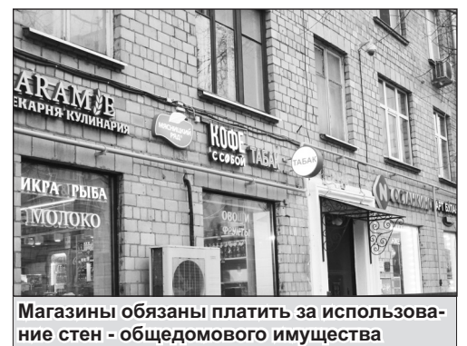
Магазины обязаны платить за использование стен – общедомового имущества