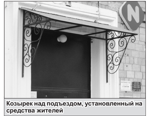
Козырек над подъездом, установленный на средства жителей

- Но чтобы все получилось красиво и качественно, в процессе ремонта пришлось решать много проблем. Приведу пример. За 60 лет ступени лестничных маршей были сильно обиты – большие и малые сколы имели примерно 100 ступеней. В итоге долго выбирали способ их ремонта. Выбрали восстановление ступенек при помощи быстротвердеющих бетонов и современных полимерных материалов. Это в несколько раз надежнее плиточных покрытий и смот-