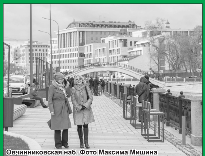
Овчинниковская наб.