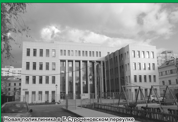
Новая поликлиника в Б.Строченковском переулке