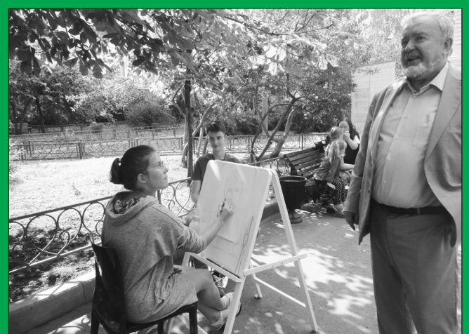
День города. Фоторепортаж из Михайловского парка Натальи Владимировой