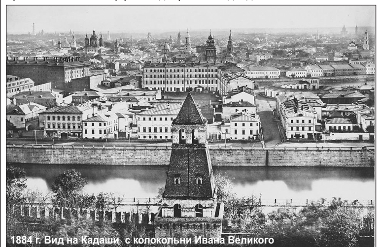
1884 г. Вид на Кадаши с колокольни Ивана Великого

Кадашёвцы были искусными мастерами и производили поистине художественные изделия. Славилась ткачи своими украшенными вышивкой посольскими скатертями, которые предназначались для особых торжеств и приемов во дворце. Известно, что в слободе рядом с ткачами и швеями жили художники и ювелиры. Работая на царский двор, кадашёвцы были тесно связаны с Оружейной палатой и придворным искусством, но при этом оставались самобытными мастерами с подлинно народными особенностями творчества. Высокое умение ткачей Кадашёвской слободы достигалось в том числе